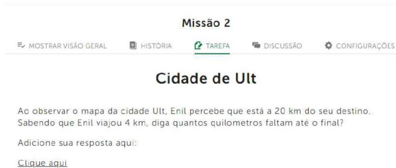
Figura 3: Exemplo de missão no Classcraft do IECN

Na opção de corrigir individualmente a tarefa de um aluno, a equipe seleciona a aula desejada e pode enviar de forma privada o retorno do desempenho do estudante. Se o estudante estiver realizando uma atividade e possuir alguma dúvida, pode postar um comentário na aba “Discussão” ou enviar a pergunta para o membro da equipe responsável por esta tarefa. Da primeira maneira, todos os alunos poderão ver e responder, além do professor e dos residentes. Nas atividades que foram propostas, os alunos utilizaram este espaço para informar eventuais problemas técnicos, naturais quando estamos iniciando um projeto tão desafiador. E assim a readequação da atividade foi sendo feita ao longo do processo, até com a contribuição dos próprios alunos da escola.