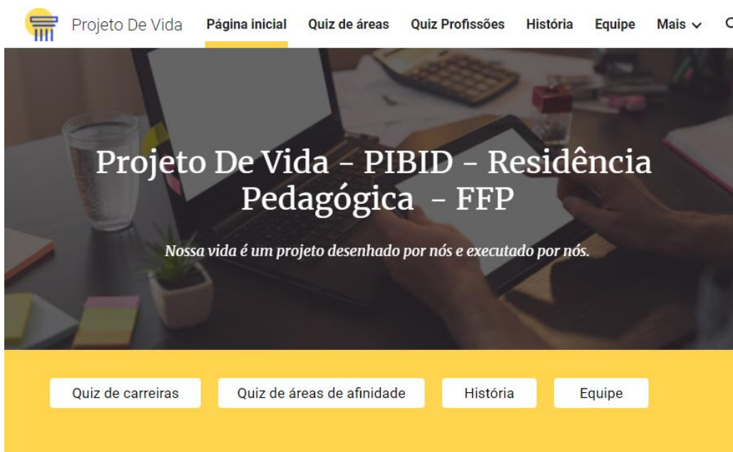
Figura 4: Imagem do site do Projeto de vida desenvolvido pela equipe do RP

Além da disciplina de Projeto de Vida, outras discussões surgiram e a elaboração de propostas foi feita pela equipe do RP na escola sobre as disciplinas eletivas de modelagem matemática e de educação financeira. Infelizmente, com a finalização do projeto em abril de 2022 não foi possível acompanhar todo o processo até a implementação das ideias para essas disciplinas e nem os desdobramentos do primeiro ano de implantação do Novo ensino Médio no estado do Rio de Janeiro.