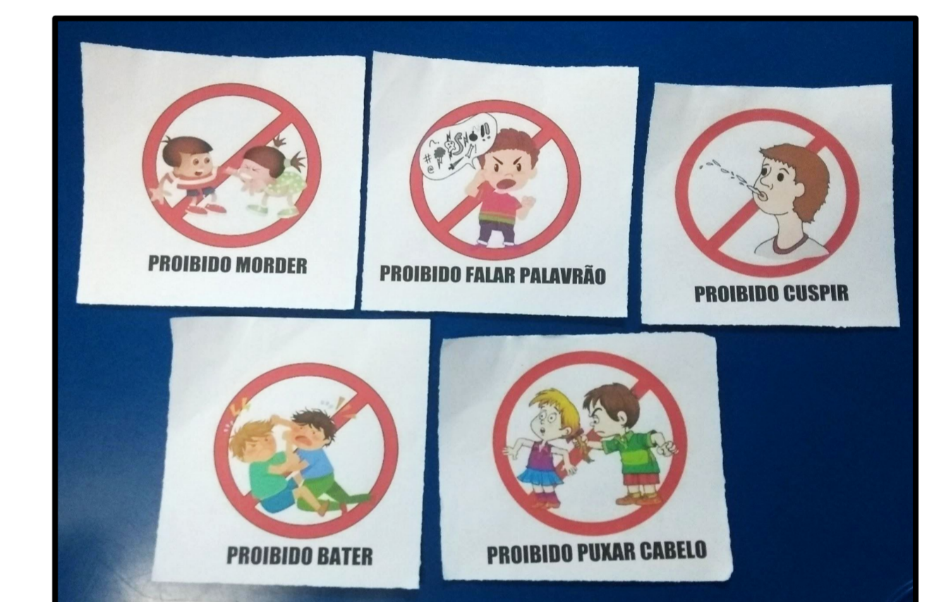
Figura 6: Cartões de comunicação alternativa e ampliada para reconhecimento de atitudes incorretas.