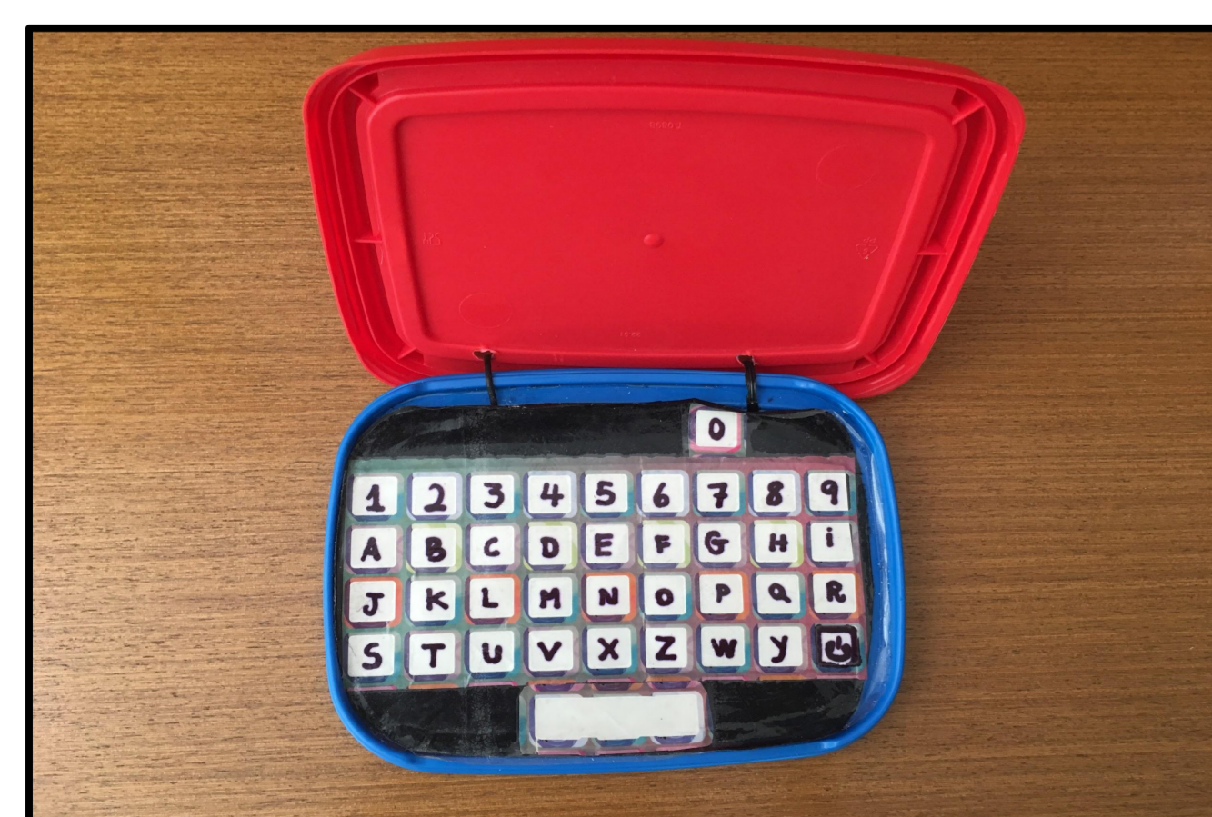
Figura 2: Computador de brinquedo para trabalhar reconhecimento do alfabeto e dos algarismos.