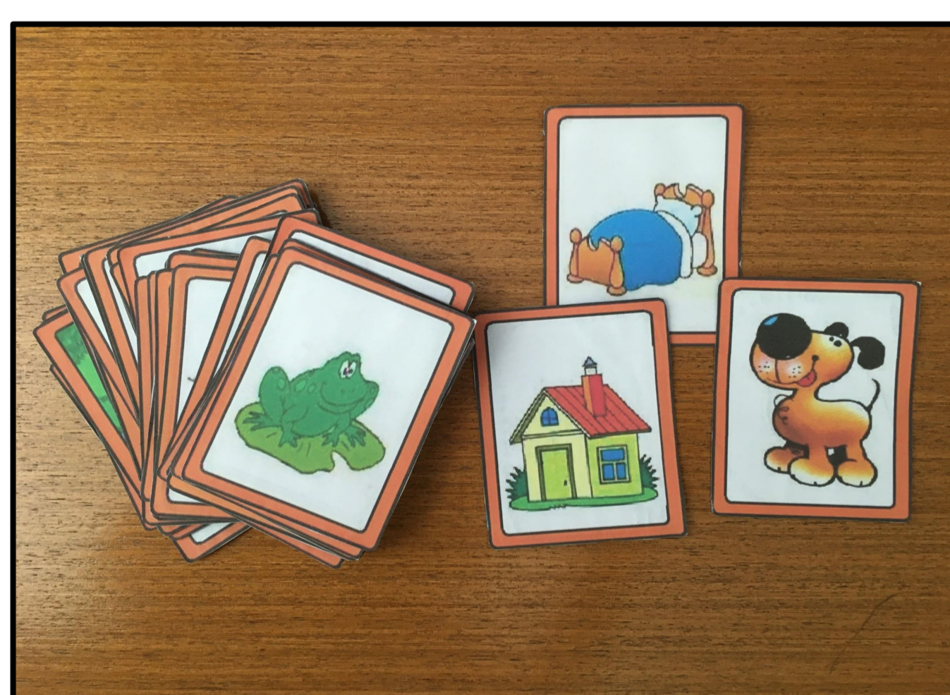
Figura 1: Baralho silábico.

Os materiais produzidos abrangem o conteúdo visto em sala de aula, para que o aluno com necessidades educacionais especiais esteja sempre acompanhando os alunos neurotípicos e se sinta, de fato, como sendo pertencente àquele espaço e turma. Além disso, é importante verificar as dificuldades motoras, cognitivas e sociais do aluno, para que estas também sejam trabalhadas durante o atendimento educacional especializado.