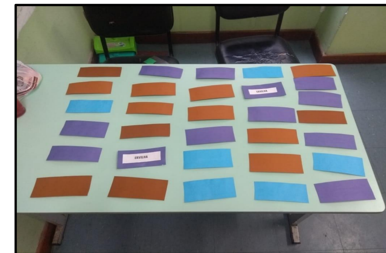
Figura 4: Jogo da memória com palavras retiradas do texto A Princesa e a Ervilha trabalhado em sala.