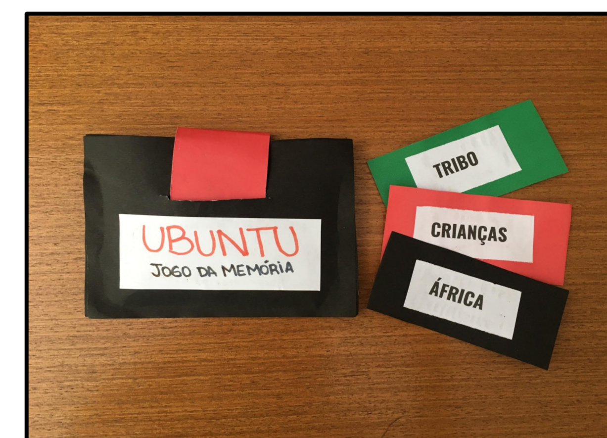
Figura 5: Jogo da memória com palavras retiradas do texto Ubuntu trabalhado em sala.