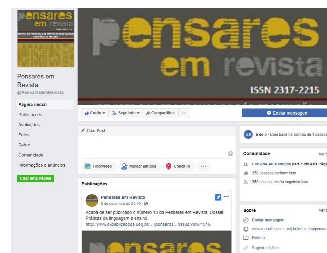
Página da Pensares em Revista no Facebook